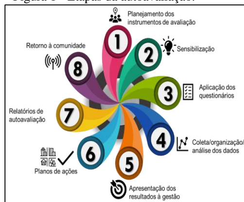
Figura 1 - Etapas da autoavaliação.

A CPA/Núcleo de autoavaliação no IFFar, organiza o ciclo de autoavaliação conforme se apresenta na Figura 1: