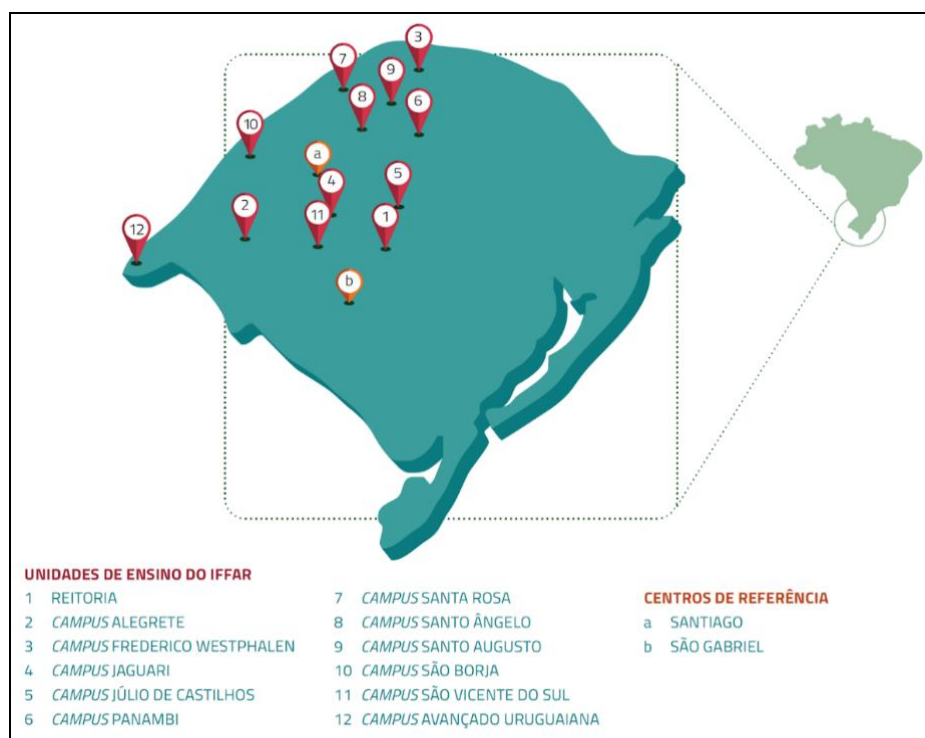
Figura 1 - Mapa de abrangência IFFar