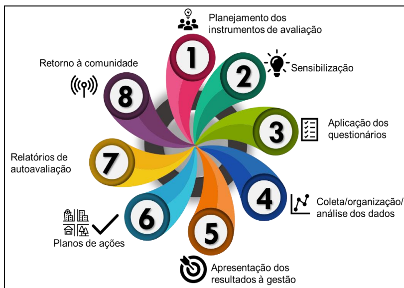
Figura 2- Etapas da autoavaliação

Abaixo apresenta-se na Figura 2, como a CPA/Núcleo de autoavaliação no IFFar, organiza o ciclo de autoavaliação: