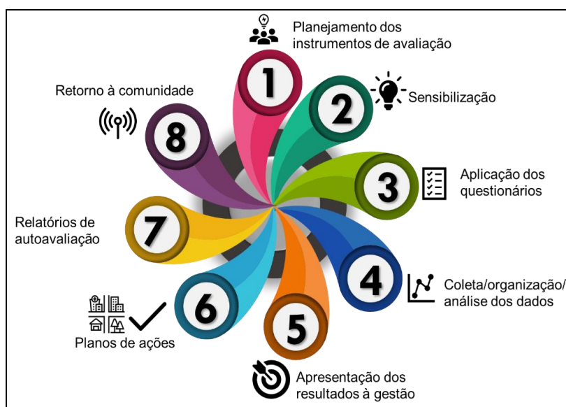
Figura 1 - Etapas da autoavaliação

Abaixo apresenta-se como a CPA/Núcleo de autoavaliação no IFFar, organiza o ciclo de autoavaliação: