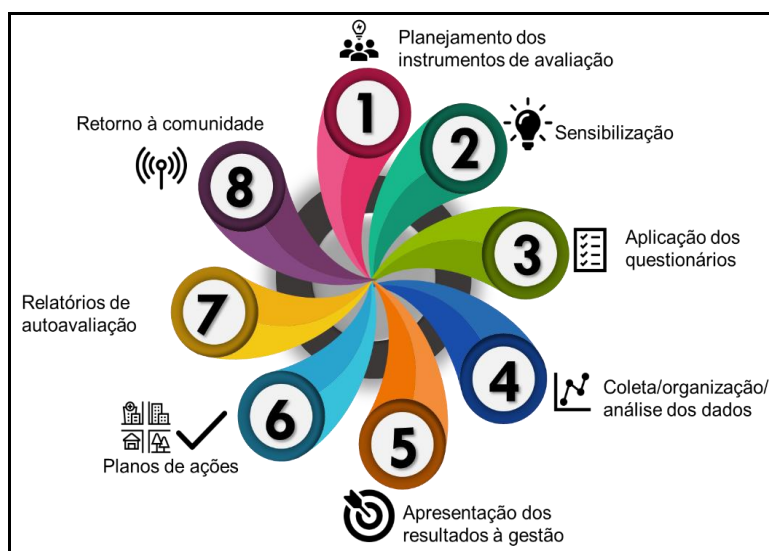
Figura 2 - Etapas da autoavaliação

Abaixo, apresenta-se na Figura 2 como a CPA e o Núcleo de autoavaliação no IFFar, organizam seu Ciclo de autoavaliação: