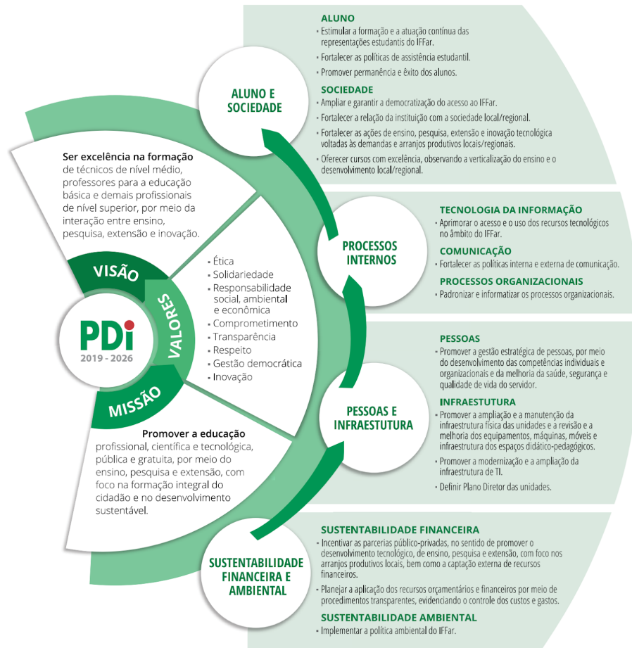
Mapa estratégico do PDI 2019-2026

A matriz de riscos, cuja metodologia de avaliação está no Anexo III , apresenta-se da seguinte forma: