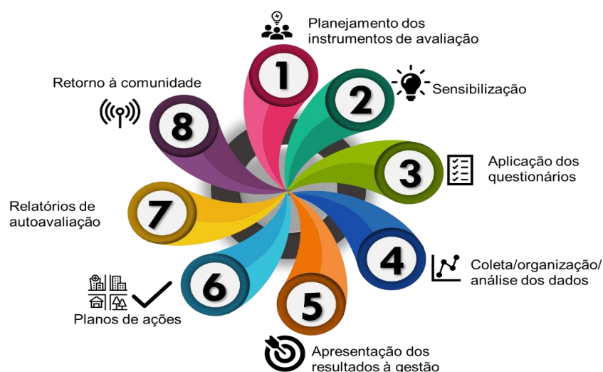
Figura 4 - Ciclo de autoavaliação

Abaixo apresenta-se como a CPA, no IFFar, organiza o ciclo de autoavaliação: