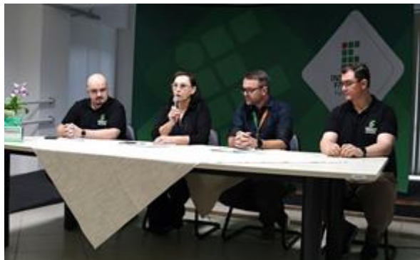
Foto: a reitora do IFFar falou da importância da CPA e da CAIN durante abertura do Seminário de Avaliação - Fonte: SECOM/2024

Foto: Seminário de Avaliação Institucional reuniu servidores dos campi do IFFar na Reitoria - Fonte: SECOM/2024