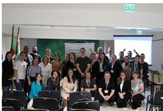
Foto: servidores do IFFar participam de evento sobre Avaliação Institucional na Reitoria

Foto: o presidente da CPA da UFSM, Fernando Pires Barbosa, ministrou duas palestras durante o Seminário de Avaliação do IFFar