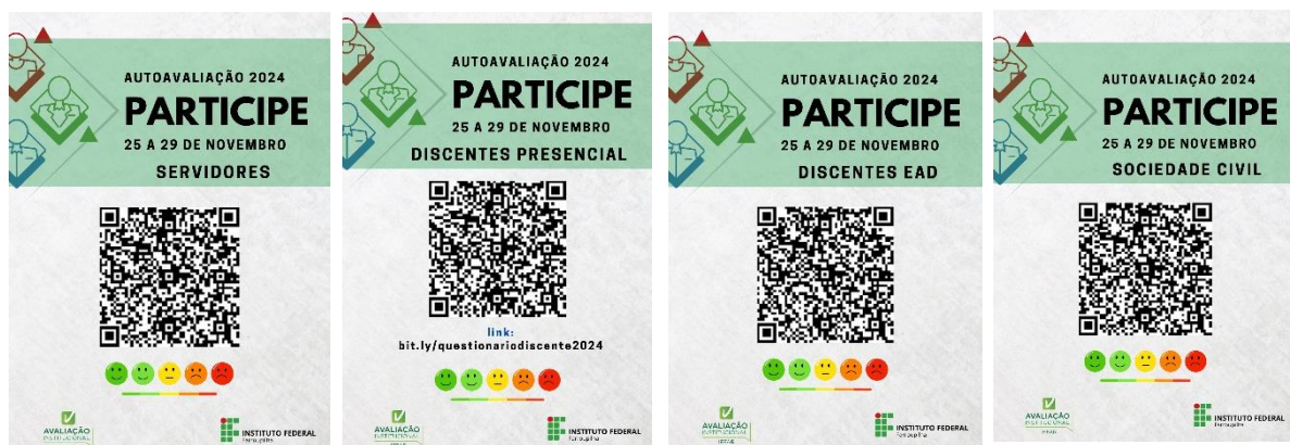
Figura 3– Card's – QR Code

A campanha incluiu, ainda, material impresso, como cartazes e folders, para distribuição nos campi . Os cartazes foram afixados em locais de maior fluxo nos campi . Eles continham informações sobre data e orientação para utilização de QRCode para acessar os formulários da pesquisa, conforme imagens abaixo: