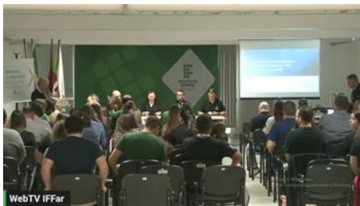
Foto: servidores do IFFar participam de evento sobre Avaliação Institucional

O evento oportunizou a formação e a troca de experiências entre a comunidade acadêmica sobre os processos de avaliação institucional. Esse processo é um mecanismo orientador para o planejamento das ações vinculadas ao ensino, à pesquisa e à extensão, bem como para as atividades que lhe servem de suporte. Ele se caracteriza como um movimento contínuo e ativo de participação coletiva que prima por melhorias na qualidade do trabalho e das ações desenvolvidos e ofertados pela instituição. Ainda, é necessário destacar que a realização do Seminário no formato presencial visa ao atendimento do PDI , no que se refere ao objetivo estratégico 5: (...) - Meta 10: (...), nas ações: