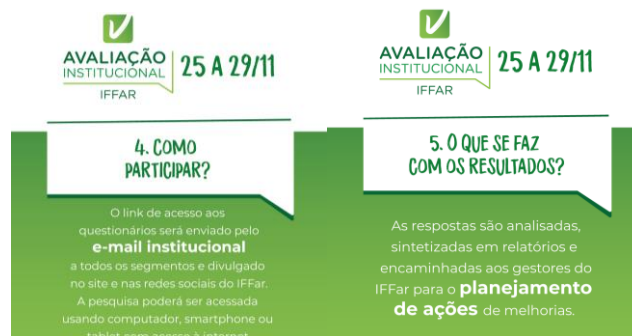
Figura 2 – Card's explicativos do que é autoavaliação - Autoria SECOM - Fonte CPA

A campanha incluiu, ainda, material impresso, como cartazes e folders, para distribuição nos campi . Os cartazes foram afixados em locais de maior fluxo nos campi . Eles continham informações sobre data e orientação para utilização de QRCode para acessar os formulários da pesquisa, conforme imagens abaixo: