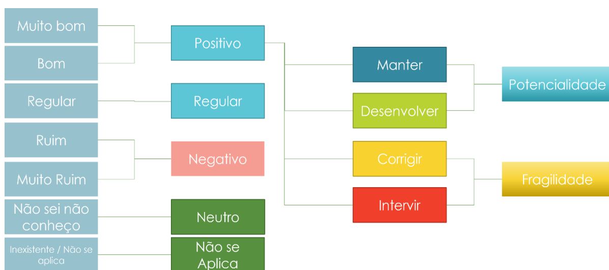
Figura 5 - Indicadores, avaliação e categorização dos resultados - Autoria e Fonte CPA

A seguir, apresenta-se a ilustração dos indicadores, avaliação e categorização dos resultados: