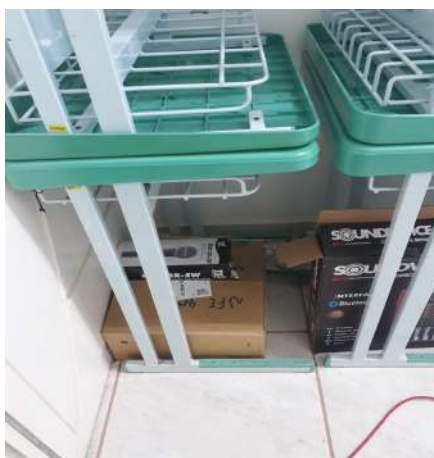
Figura 5 - Corredor Prédio Almojarifado