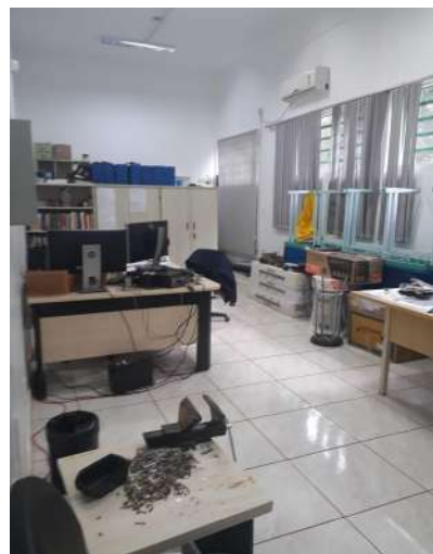
Figura 7 - Sala Infraestrutura (Coordenação)