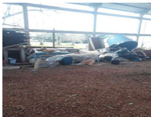
Figura 2 - Galpão das Máquinas Agrícolas