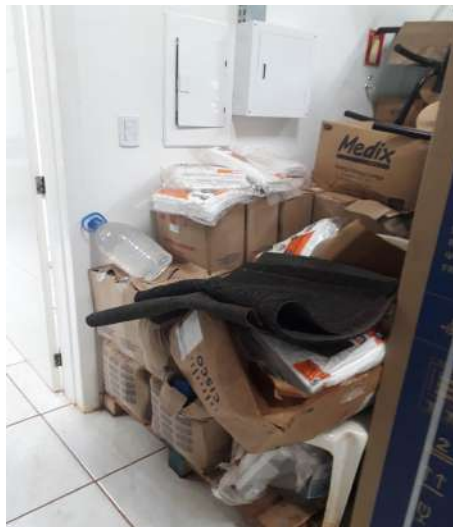
Figura 4 - Corredor Prédio Almojarifado