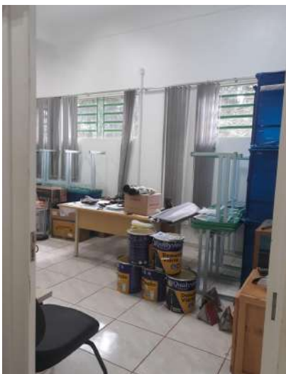
Figura 6 - Sala Infraestrutura (Coordenação)

utilizados nas atividades pela infraestrutura, conforme registro fotográfico abaixo. Ambas as salas estão com bens de consumo e bens móveis, não havendo uma sala destinada exclusivamente para o estoque.