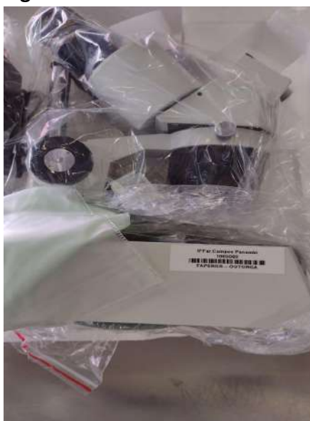
Figura 1. Bem Móvel nº 1065082.

1.4 Verificou-se, durante a inspeção física, que os bens adquiridos mediante projetos estão de posse dos pesquisadores com o documento denominado Termo de Outorga, sendo que a qualquer momento poderá contatar a CAP para abertura do processo referente às incorporações. Ao efetuar a incorporação ao patrimônio do Campus na etiqueta consta a informação da outorga, conforme a figura abaixo: