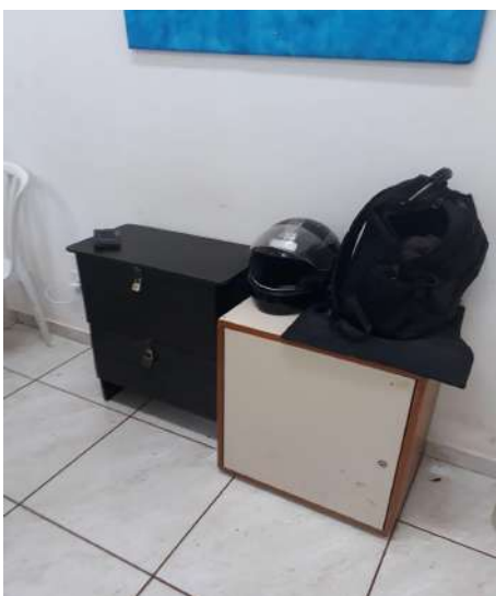
Figura 10 - Cozinha Prédio Almojarifado

1.6 Verificou-se durante a inspeção física que em algumas salas/setores há móveis que aparentemente não fazem parte do Patrimônio do Campus . Estes bens não possuem plaqueta de identificação e possuem características diferentes dos bens do acervo patrimonial, conforme registros fotográficos abaixo. Salienta-se que não foi apresentado Termo de Responsabilidade ou Lista de Controle.