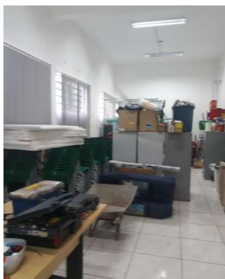
Figura 9 - Sala Infraestrutura (Terceirizado)