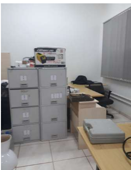
Figura 8 - Sala Infraestrutura (Terceirizado)