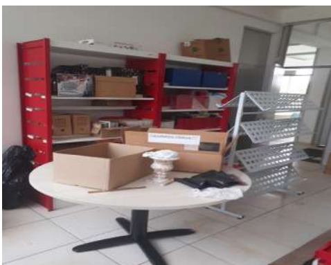
Figura 1 - Depósito da Biblioteca

1.4 Ao efetuar a inspeção dos bens móveis a equipe de auditoria verificou que em alguns ambientes/salas/setores há materiais de consumo e bens móveis sujos e armazenados de forma desorganizada, conforme registros fotográficos abaixo.