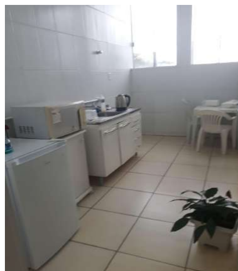
Figura 11 - Cozinha Prédio Administrativo