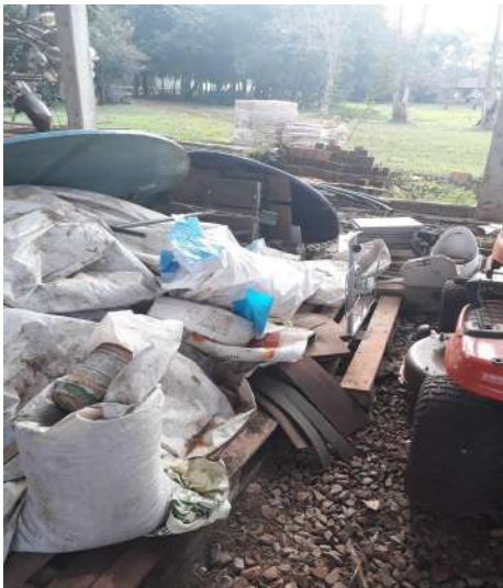
Figura 3 - Galpão das Máquinas Agrícolas