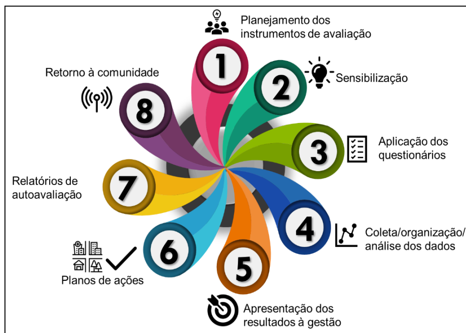
Figura 2 — Etapas da autoavaliação