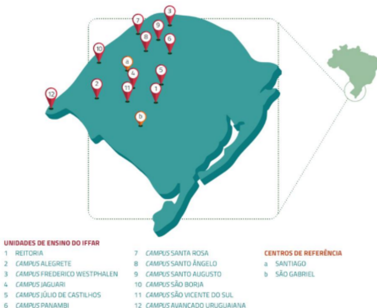
Figura 1 — Distribuição dos campus IFFar

e Centros de Referência Santiago e São Gabriel. Conforme ilustração do mapa de abrangência, destaque na Figura 1: