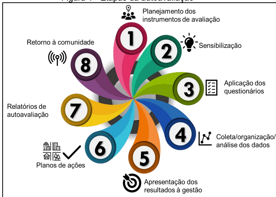
Figura 1 - Etapas da autoavaliação